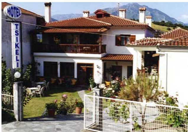
Die Pension in Meteora