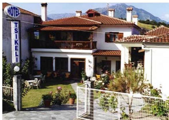
Das Hotel in Meteora