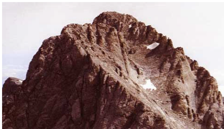
„Mitikas“ einer der beiden Olymp-Gipfel

Für diese Tour ist Trittsicherheit erforderlich. Um über einige bis zu 1,5 m große Absätze zu kommen wird es auch mal notwendig die Hände zu Hilfe zu nehmen. Am Olymp ist Kondition für etwa 6-stündige Touren im hochalpinen Gelände notwendig.