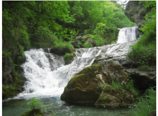
Im Aufstieg zum Olymp

um den Olymp zu besteigen sollte man einige Tage zuvor seine Beine etwas warmlaufen. Wir machen dies zu einer Tugend, in dem wir eines der wildesten und schönsten Wandergebiete Nordgriechenlands dafür vorsehen. Wenn im Mai die Temperaturen für körperliche Bewegungen noch nicht so heiß wie im Sommer sind, fühlt man sich hier wie im Paradies. Unser Weg führt uns über selten begangene Hirtenwege, durch wildeste Schluchten, vorbei an uralten knorrigen Eichen zu kleineren Gipfeln, welche unbeschreibliche Tiefblicke erlauben.