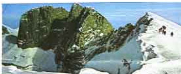
Der Sitz der Götter