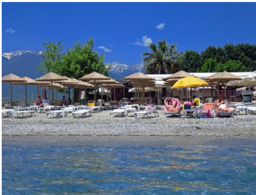
Blick vom Ägäischen Meer zum Olymp

Ein anschließender Kultur- oder Badeurlaub ist um diese Zeit auch ohne Hotel-Reservierung möglich.